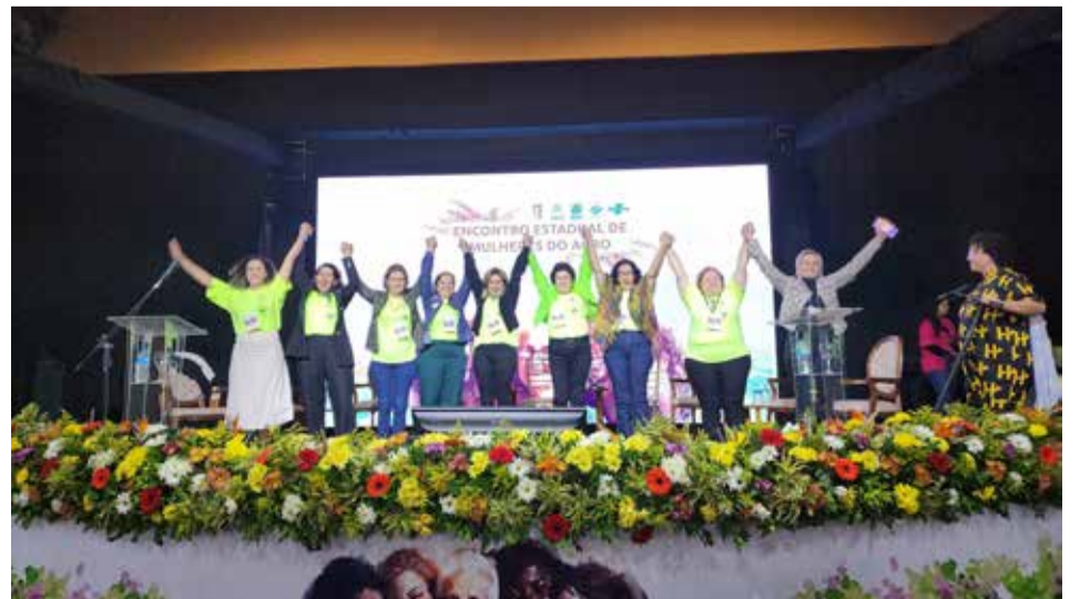
O “Encontro Estadual de Mulheres do Agro” causou impacto positivo em suas participantes