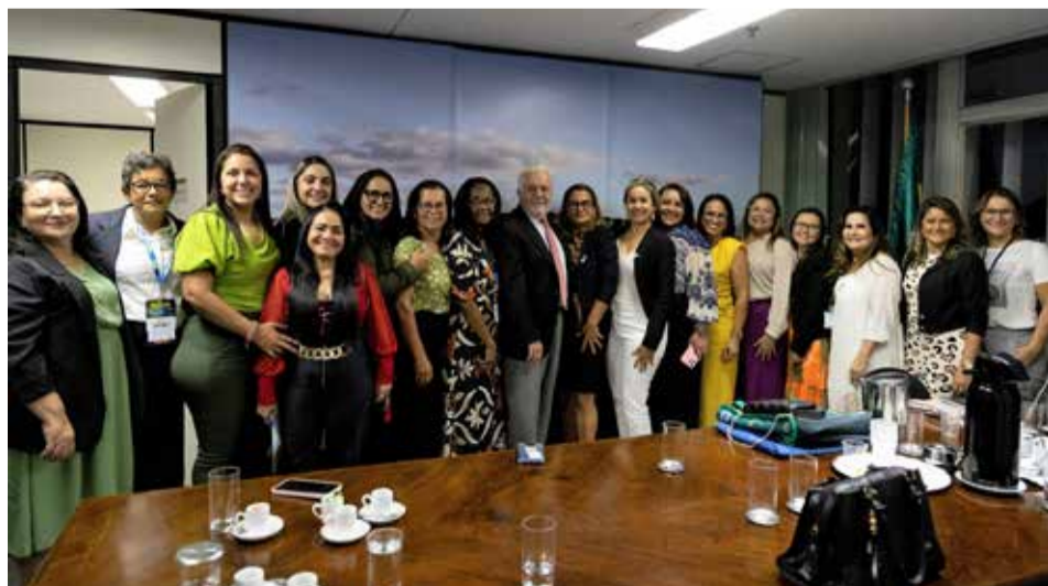
Reunião inédita de prefeitas do Brasil com diretoria do banco

O Instituto Alzira, responsável pela interlocução das 12 prefeitas com o BNDES, acena o compromisso de novas reuniões, para resolução das pautas apresentadas.