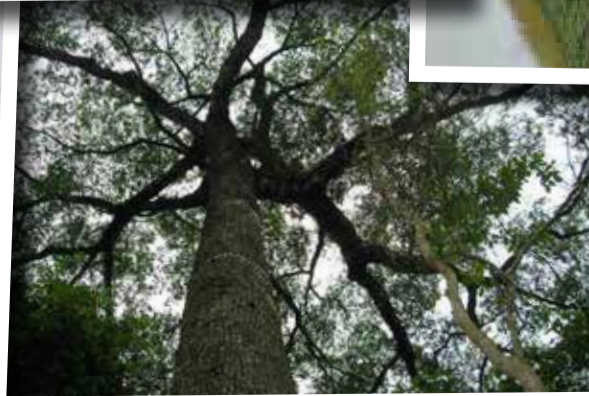
Foto 1 - (Em cima) Portal da cidade; Foto 2 - (Em cima) Rômulo Luiz de Lima Ripa, prefeito de Porto Ferreira; Foto 3 - Circuito da Cerâmica; Foto 4 - Cerâmica utilitária; Foto 5 - Ponte Metálica; Foto 6 - Cerâmica decorativas; Foto 7 - Árvore gigante