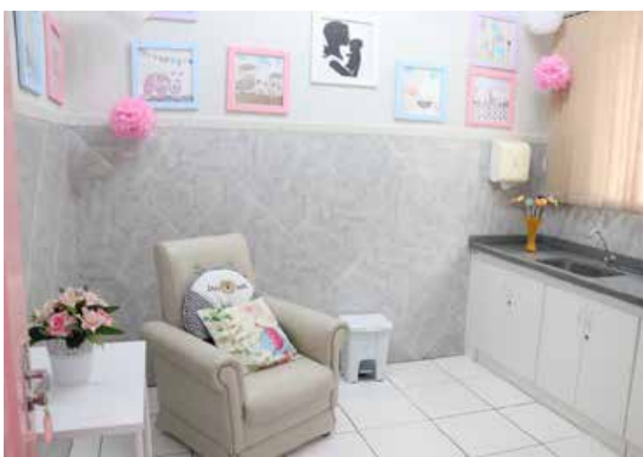
Sala de amamentação em escola no município de Marília

Patricia de Campos Jornalista patricia.campos@uvesp.com.br