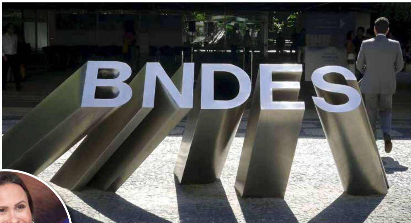
BNDES abre espaço para ouvir sugestões de gestoras municipais do país

A reunião permitiu que o BNDES viesse a conhecer as necessidades dos municípios, podendo estabelecer futuras linhas de crédito voltada para essas necessidades.