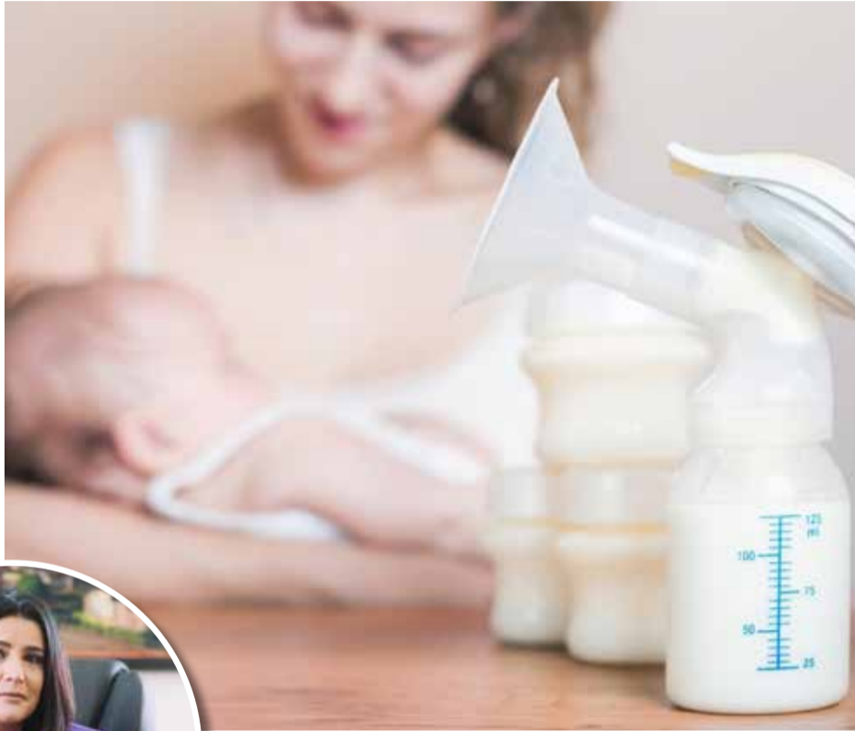
Os “Pontos de Afeto” tem ambiente apropriado para mãe amamentar ou retirar seu leite para armazenar