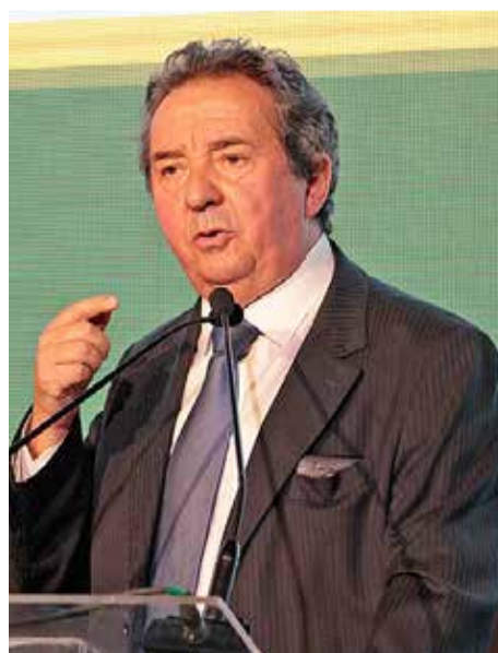
Sérgio Ciqueira Rossi, secretário-Diretor Geral do TCE/SP

Quando os jurisdicionados estão dentro da Lei e da Constituição, o Tribunal de Contas cumpre o seu papel. Quando os controladores de contas se colocam acima da Lei e da Constituição, o Tribunal de Contas lhe é superior