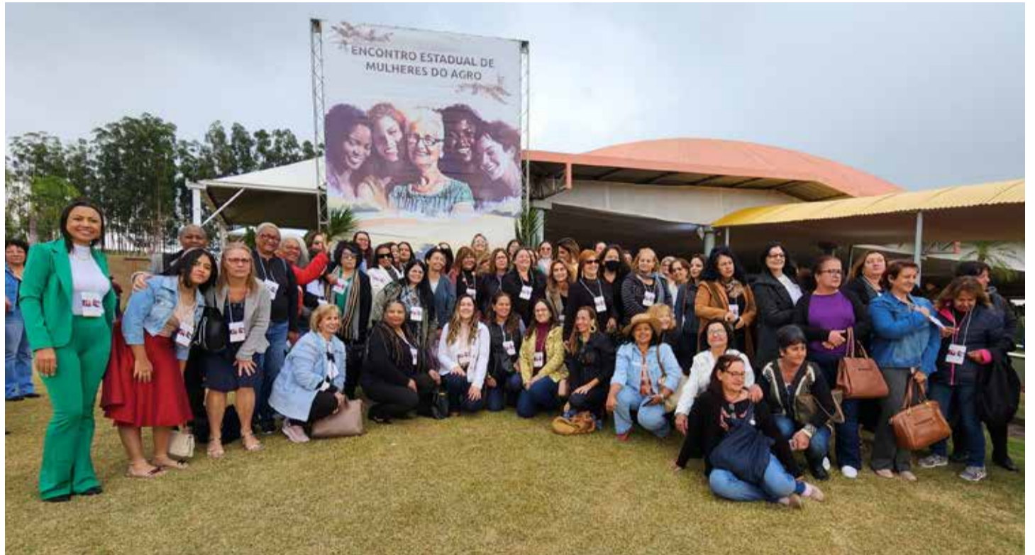
A cidade de Lins recebeu as lideranças femininas do agronegócio em congresso

Com tudo isso em mente, aconteceu no último dia 30 de agosto o primeiro “Encontro Estadual de Mulheres do Agro”, realizado na cidade de Lins. O evento contou com a presença de cerca de 1.200 mulheres que olham o setor rural bra-