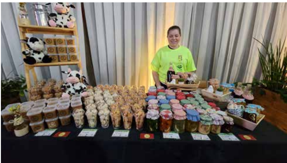
O encontro contou ainda com exposição de produtos rurais e artesanais