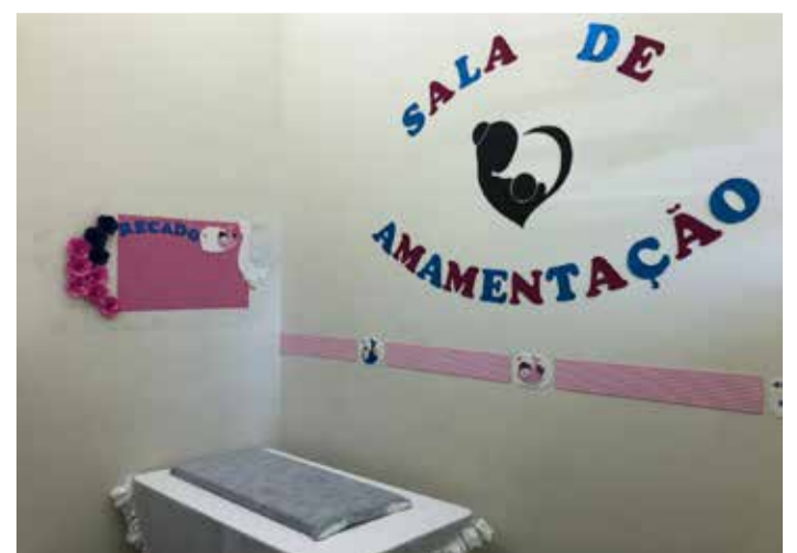
Sala de amamentação no município de Jaú