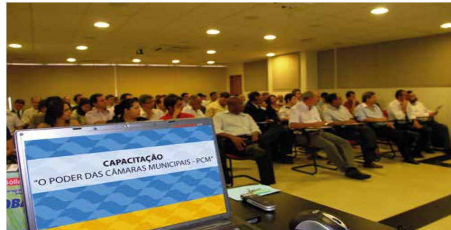
Curso em parceria com o Tribunal de Contas