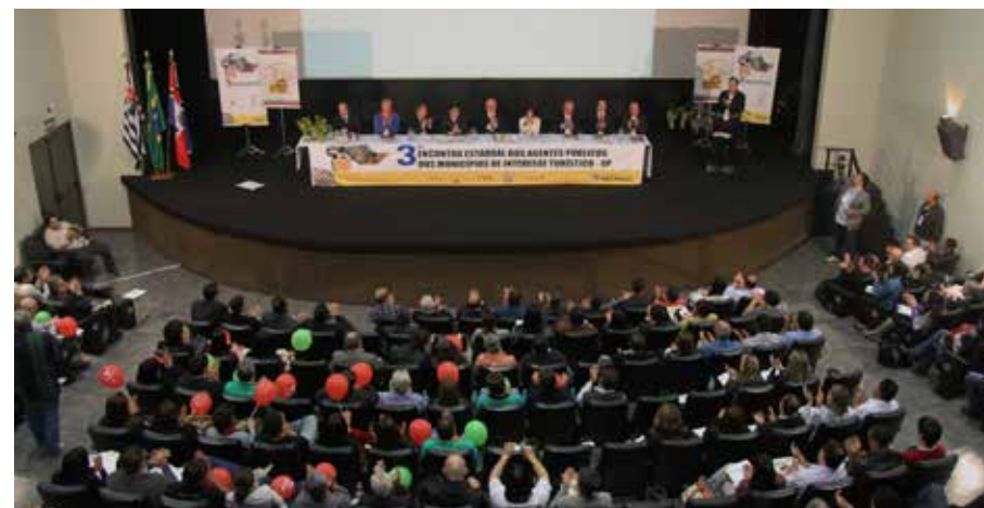
Seminário de Turismo