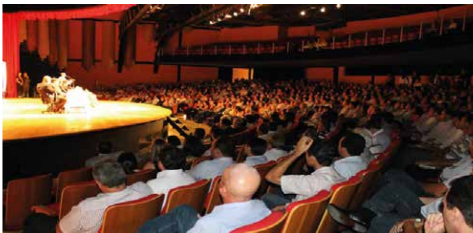
Caravana da Inclusão, Acessibilidade e Cidadania