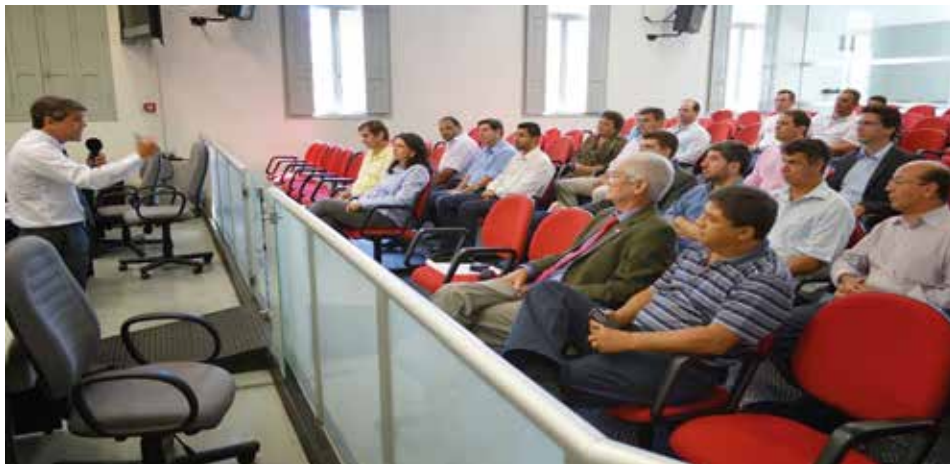
Reunião com Parlamentos Regionais